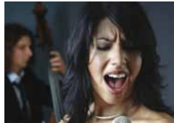
Hotel Bossa Nova