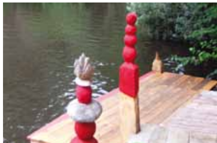
Neuer Anleger Goldbekhaus

Man muss nicht länger im Regen stehen, kann dafür aber schöner duschen und kommt mit dem Boot besser weg. Das neue Vordach, der einladende Halleneingang, die Renovierung der Duschen, WCs und Umkleiden, das neue Parkett im Seminarraum 1, der neue Bootsanleger sind Neuerungen, mit denen das Goldbekhaus sein Erscheinungsbild in den Sommermonaten weiter verbessert hat. Dafür danken wir nochmals allen Geldgebern (Bezirk Hamburg –Nord und Behörde für Kultur, Sport und Medien) und allen beteiligten Baufirmen, dem Architekten Bernd Joachim Rob und dem Holzkünstler Karsten Dreger. Ein dickes Dankeschön geht auch an alle, die Baulärm und Staub ertragen mussten und mitgeholfen haben, dass alles gut geklappt hat.