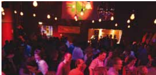
Winterhuder Tanznacht – die Kultdisco in Winterhude!