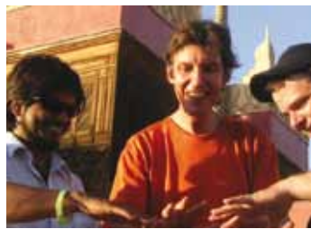
World Drum Trio