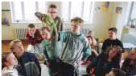
Wer küsst schon einen Leguan?