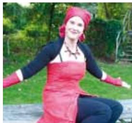
Belle de Jour