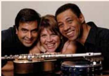
Trio Café Brasil