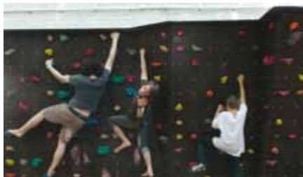
Kletterwand am Goldbekhaus