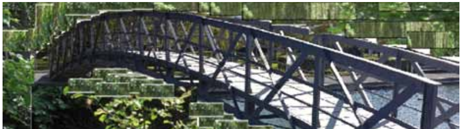
Brücke zum Goldbekplatz (Fotomontage »Wir sind Winterhude«)

Weitere Infos: www.wir-sind-winterhude.de