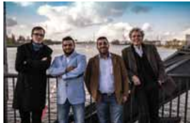
Les Hommes du Swing