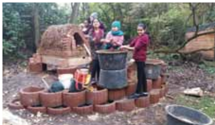
2016 wurde der Lehmofen gebaut.

Bauspielplatz Poßmoorwiese, Poßmoorweg 50 /Ecke Barmbeker Straße, Fon: 040-279 69 58 | Eintritt frei