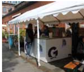
Flohmarkt auf dem Hof