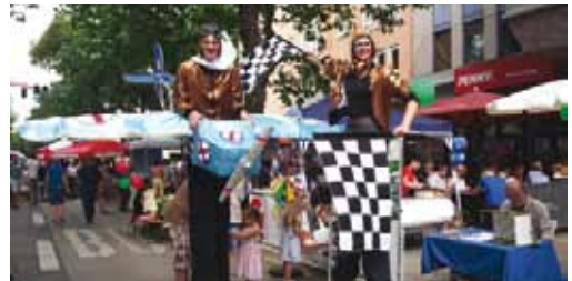
OAKLEAF-Stelzenkunst ist beim Auftakt am 27.August auch dabei