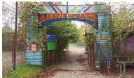
Eingang Bauspielplatz Poßmoorwiese