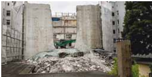
In der Forsmannstraße ist der Bunker abgerissen worden..