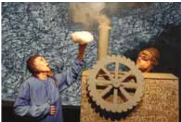
Das Fliegende Theater: »Die kleine Wolke«

Haus Drei in Altona, Hospitalstraße 107 | Eintritt frei, außer Kindertheater 3,- / 1,50 Karten im Haus Drei, Fon: 040-388 998 | Infos: www.haus-drei.de oder www.wuestenschiff-kindertheater.de