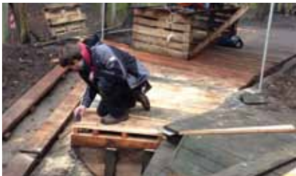
Der Fleißige Felix

Loyana Camelo, loyana.camelo@goldbekhaus.de