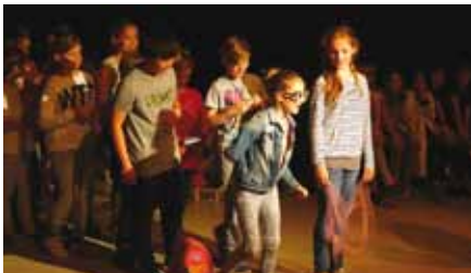
Kinder der Grundschule Forsmannstraße

Bühne zum Hof | TK 4,- (Erwachsene) / 3,- (Kind) | VVK 3,50 / 2,50