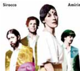
Sirocco (Cover Amirim)