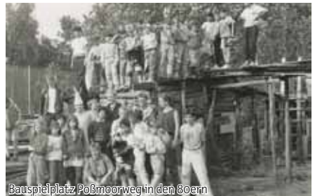
Bauspielplatz Poßmoorweg in den 80ern

Wohnraum für Jugendliche, Gottschedstr. 6 Fon 040 279 64 74 | www.hude.de