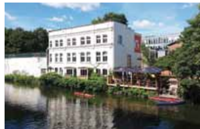
Seit Ende März ist die Terrasse des CHAPEAU geöffnet!