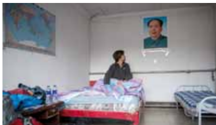
Stephan Orth im Bett mit Mao Tse Tung...

Bühne zum Hof | AK AK 12,- / 10,- | VVK 12,- / 10,- (zzgl. evtl. anfallender Vorverkaufsgebühren)