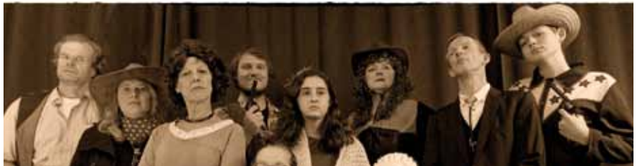
Ensemble theater noster

Bühne zum Hof | AK 15,- / 12,- | VVK 12,- / 10,- (zzgl. evtl. anfallender Vorverkaufsgebühren)