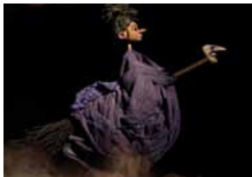
Die kleine Hexe Siebenreich

Bühne zum Hof | TK 7,-(Erw.) / 5,50 (Kind) | VVK 5,50 / 4,- (zzgl. evtl. anfallender Vorverkaufsgebühren)