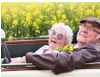
Frau Schnipplers unglaubliche Reise...