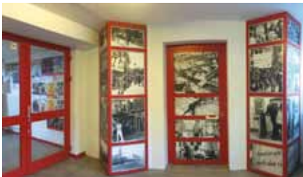
Bilder im Foyer

Foto und Text: loyana.camelo@goldbekhaus.de