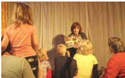
Kinder und Eltern im Lesenest

Kinderetage | TK 2,-(Erw.) / Kinder frei