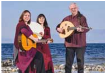
Meta ti Fourtuona

Bühne zum Hof | AK 16,- / 13,- | VVK 13,- / 10,- (zzgl. evtl. anfallender Vorverkaufsgebühren)