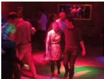
Stompin' at the Goldbekhaus (nächste Seite)