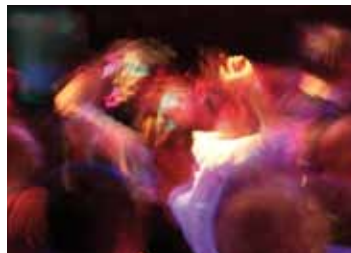
Winterhuder Tanznacht (nächste Seite)