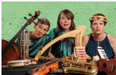
Die Feen in Absinth

Bühne zum Hof | AK 16,- / 13,- | VVK 13,- / 10,- (zzgl. evtl. anfallender Vorverkaufsgebühren)