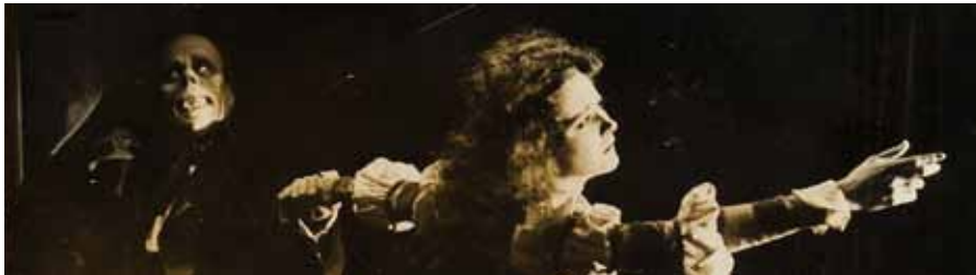
Das Hamburger Horrortheater

Bühne zum Hof | AK 15,- / 12,- | VVK 13,- / 10,- (zzgl. evtl. anfallender Vorverkaufsgebühren)