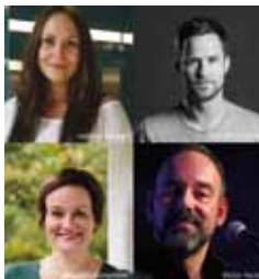
Geschichtsalon – der Dritte