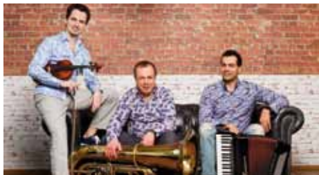
Hamburg Klezmer Band

Bühne zum Hof | AK 16,- / 13,- | VVK 13,- / 10,- (zzgl. evtl. anfallender Vorverkaufsgebühren)