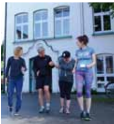
Fit im Quartier