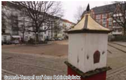
Ganesch-Tempel auf dem Schnickelplatz

Beratung und Information für Frauen, Moorfuhrweg 9b Fon 040 280 79 07