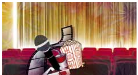
Welcome Movies und Karaoke