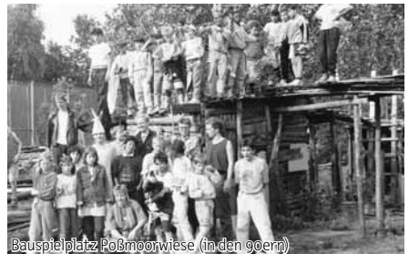
Bauspielplatz Poßmoorwiese (in den goern)

Wohnraum für Jugendliche, Gottschedstr. 6 Fon 040 279 64 74 | www.hude.de