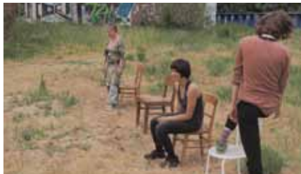
Kollektiv Frau von Stuhl

Halle | AK + VVK 10,- / 6,- (zzgl. evtl. anfallender Vorverkaufsgebühren)