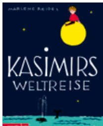
Singen ist stark!

Bühne zum Hof | Eintritt frei (Spenden erwünscht)