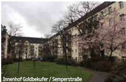
Innenhof Goldbekufer / Semperstraße

Beratung und Information für Frauen, Moorfuhrweg 9b Fon 040 280 79 07