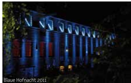
Blaue Hofnacht 2011

Wohnraum für Jugendliche, Gottschedstr. 6 Fon 040 279 64 74 | www.hude.de