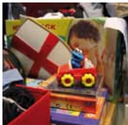
Bobbycar und Kidsklamotte