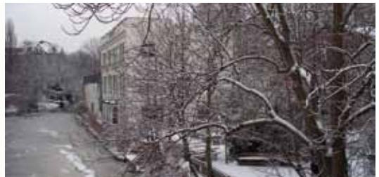
Eis auf dem Goldbekkanal 2010