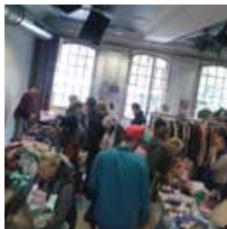
Schätze ans Licht