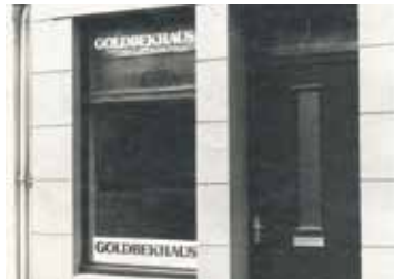
Büro Goldbekhaus 1979 in der Schinkelstraße

Wohnraum für Jugendliche, Gottschedstr. 6 Fon 040 279 64 74 | www.hude.de