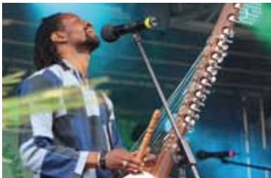
Baba Konte mit Kora

Bühne zum Hof | AK 16,- / 13,- | VVK 13,- / 10,- (zzgl. evtl. anfallender Vorverkaufsgebühren)