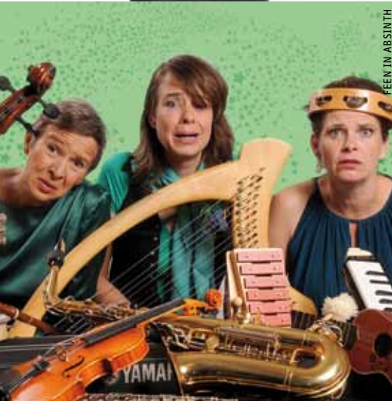
FEEN IN ABSINTH