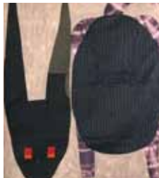
Nobuko Watabiki neu im Gastatelier