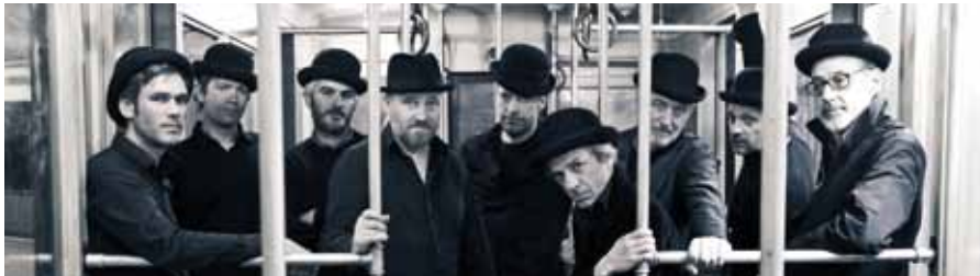
Ljodahått: Nordische Musik, Folk Jazz, Rock mit Bowler

Bühne zum Hof | AK 18,- / 14,- | VVK 14,- / 10,- (zzgl. evtl. anfallender Vorverkaufsgebühren)