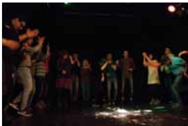
Internationale Performancegruppe SISU