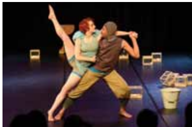
Szenen aus »The Flying Cow«