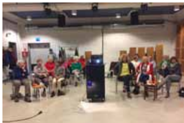
Die Herbst-Zeitlosen im Film

Heilandskirche Winterhude, Winterhuder Weg 132 | Weitere Informationen: www.ndkh.de