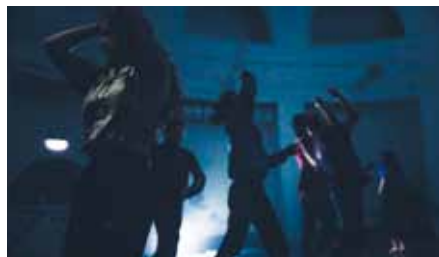
DANCINGBEASTS – Foto (c) Bahadır Berber