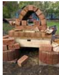
Lehmofen im Bau