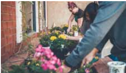
Unser Nachhaltiges Winterhude

Bauspielplatz Poßmoorwiese, Ecke Barmbeker Straße| Eintritt frei – Spenden sind gern gesehen, auch in Form von einer mitgebrachten selbstgemachten Marmelade auf das frische Brot!