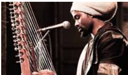
Zenda Art – Foto (c) Stephan Olbrich