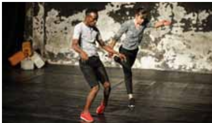
Après la mer

Halle | AK + VVK 10,- / 6,- (zzgl. evtl. anfallender Vorverkaufsgebühren)