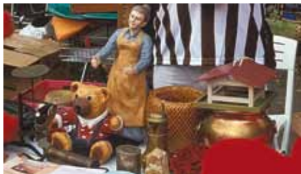
Schätze ans Licht

Halle und Bühne zum Hof | Eintritt für Besucher*innen frei