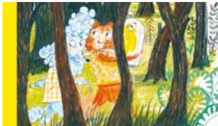
Durch den Wald