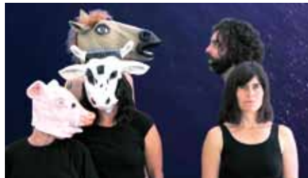
Wir Odysseus!