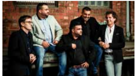
Les Hommes Du Swing