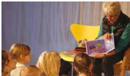
Die Alten lesen und die Jungen hören gespannt zu!

Halle | AK + VVK 10,- / 6,- (zzgl. evtl. anfallender Vorverkaufsgebühren)