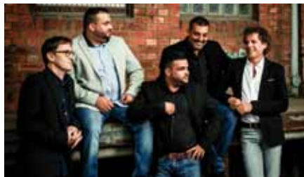
Les Hommes Du Swing