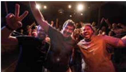
Partystimmung mit Forró!

Bühne zum Hof | AK 13,- / 10,- | VVK 10,- (Forró-Schüler*innen mit Ausweis 9,-) (zzgl. evtl. anfallender Vorverkaufsgebühren)