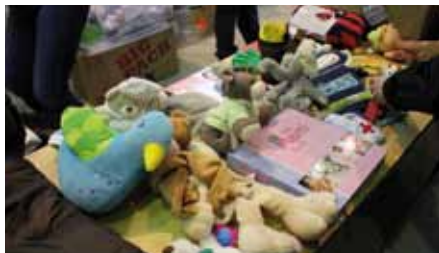
Alles für Kinder...

Halle und Bühne zum Hof | Eintritt für Besucher*innen frei