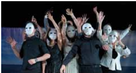
All In Theatergruppe:

Platz vor der Zinnschmelze | Maurienstraße 19 | Hamburg-Barmbek