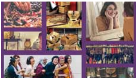
Alles für Frauen...