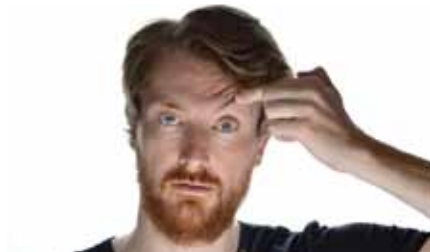
Jochen Prang

Bühne zum Hof | AK 15,- / 12,- | VVK 12,- / 10,- (zzgl. evtl. anfallender Vorverkaufsgebühren)