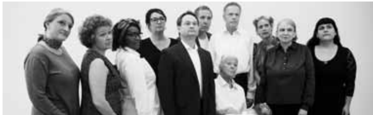
Ensemble »crazyartists«

Bühne zum Hof | AK 13,- / 10,- | VVK 11,- / 9,- (zzgl. evtl. anfallender Vorverkaufsgebühren)