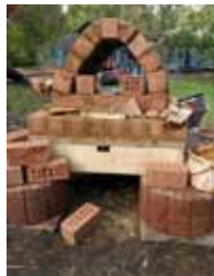
Lehmofen im Bau