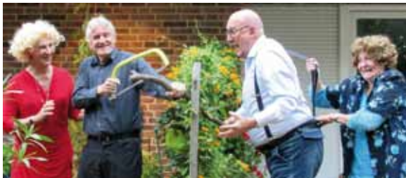
Ensemble »Theater Mobile«

Bühne zum Hof | AK 13,- / 11,- | VVK 11,- (zzgl. evtl. anfallender Vorverkaufsgebühren)