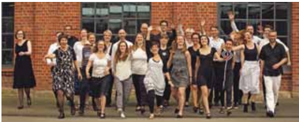
Der ZinneChor feiert die 20er-Jahre!

Halle | Konzert + Party: AK + VVK 20,- / 15,- | nur Party: 12,- / 10,- (zzgl. evtl. anfallender Vorverkaufsgebühren)