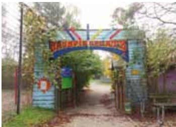
Eingang Bauspielplatz Poßmoorwiese

Bauspielplatz Poßmoorwiese, Ecke Barmbeker Straße | Eintritt frei